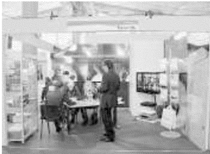
NOVITA'. Lo stand di Raymar a Carrarafiere

Presentato anche il telecomando a tenuta stagna. Piovesan: siamo leader negli speaker di bordo, puntiamo ad altri segmenti